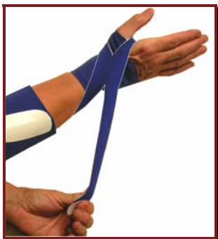
שיפור יישור כף היד וסופינצית אמה